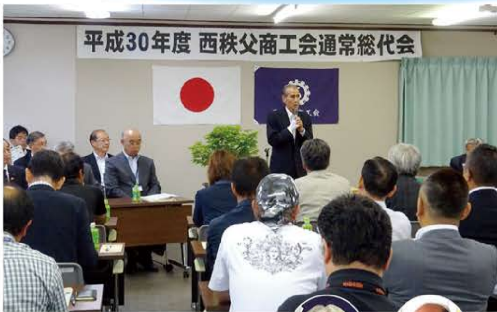
平成30年度 西秩父商工会通常総代会

平成30年度通常総代会は、5月30日西秩父商工会館において総代73名(本人出席39・委任状出席34名)の出席をいただき盛会裡に開催されました。