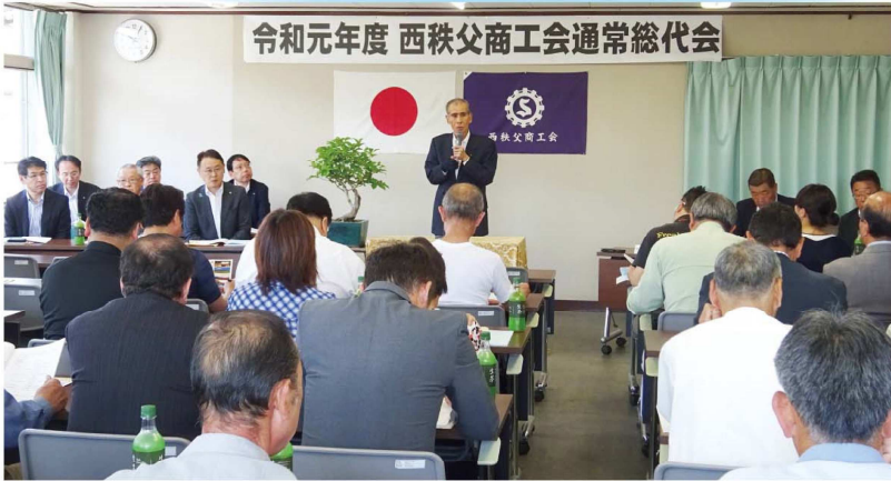
令和元年度 西秩父商工会通常総代会