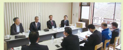
あぶくま洞施設内の意見交換会(7月24日開催)

福島県田村市の観光鍾乳洞「あぶくま洞」館内売店でちちぶのじか製品の販売が始まりました。あぶくま洞の観光推進のため、尾ノ内渓谷氷柱実行委員会が氷柱制作ノウハウを伝授したことをきっかけとした、田村市と小鹿野町の観光交流の成果です。ちちぶのじか活性化協議会では、「ちちぶのじか事業の想い」をアピールして鹿肉や単製品を販売しています。一方、あぶくまは洞窟探検のような体験型の観光開発を行っています。両者は「もの」ではなく「こと」消費の喚起という意味で共通しますので、今後もお互いに学びあう機会を作ってまいります。