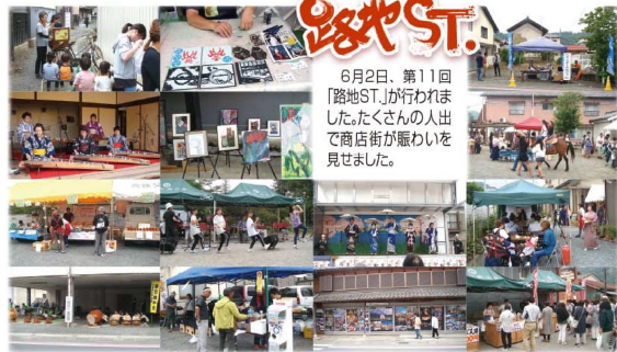
6月2日、第11回「路地ST.」が行われました。たくさんの人で商店街が賑わいを見せました。